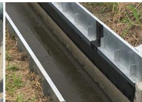
漏水補修シート(マルチメンテシート)