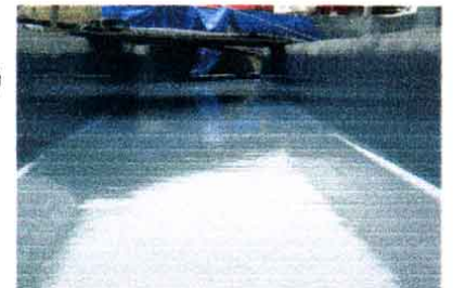
写真-2 勾配1/800の流雪溝