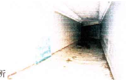
写真-1 埋設型流雪溝(可変勾配型側溝)