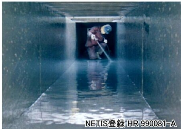
NETIS登録 HR 990081-A